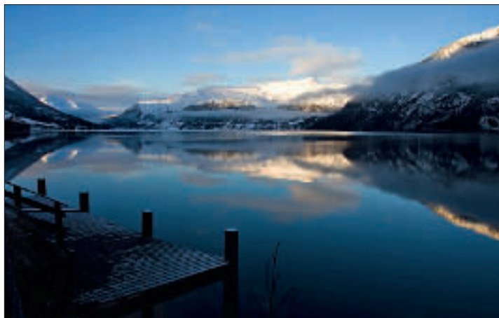
Det er ikke vanskelig å forestille seg at naturperlen Jølster er en god og givende ramme for en samling der ro og omsorg står i fokus.

Siden oppstart av LEVENytt, har LEVE hatt som mål å utgi åtte eller ni utgaver per år. Som sikkert mange av våre medlemmer har lagt merke til, har utgivelsene denne våren vært færre enn tidligere. Slik vil det også bli på høstparten av 2009. På lik linje med andre organisasjoner og bedrifter, opplever LEVE noe strammere økonomiske tider, og vi gjør de grep som er nødvendig, for å ivareta det trygge og solide fundamentet organisasjonen allerede har etablert. Samtidig har sekretariatet hatt stort fokus denne våren, på å sende ut flere prosjektsøknader til bl.a. stiftelsen Helse og Rehabilitering og Helsedirektoratet. Dette resulterer forhåpentligvis igjen i en romsligere økonomi fra 2010 og fremover.