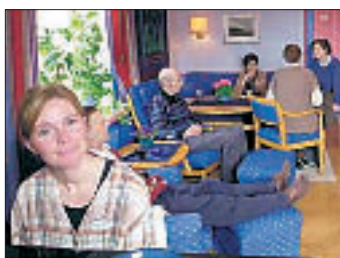
Ved Hospice Lovisenberg oppstår et lindrende fellesskap, hvor man kan lene seg på hverandre.