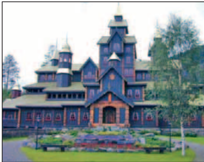
Hunderfossen er vel verdt et besøk under et Lillehammer-opphold.

avslutte dagen. I tillegg ønsker vi å legge opp til en konferanse der mye tid er viet til tid til samtaler, sier Horn Holden.