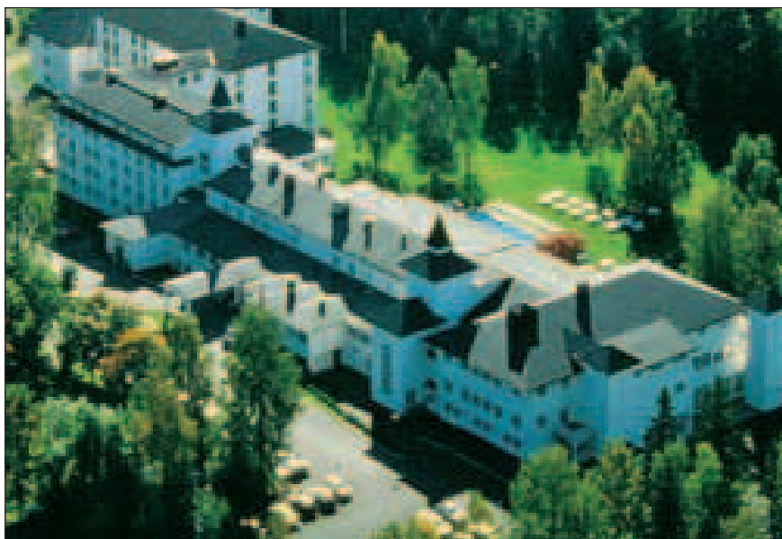
LEVEs Landskonferanse i 2005 arrangeres ved Radisson SAS Lillehammer Hotell